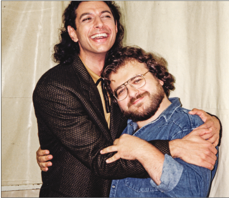
Tournage de Mister Frost (1990) : Avec Jeff Goldblum (ci-dessus) et Alan Bates (ci-dessous)