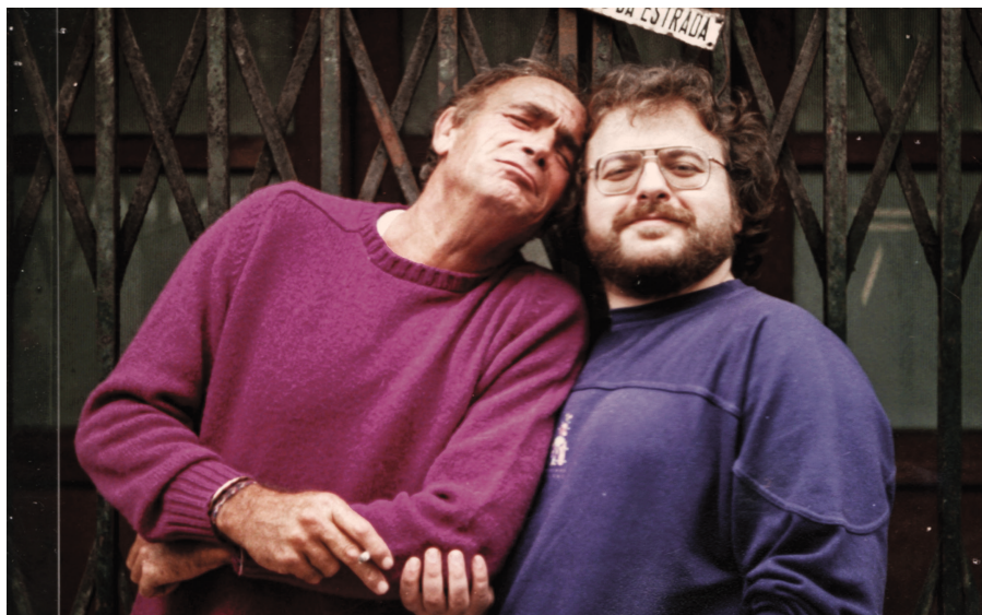
Avec Venantino Venantini lors du tournage à Lisbonne de Tango Bar (1991)