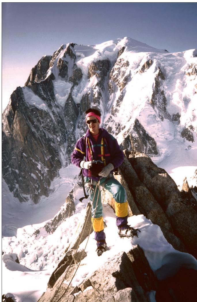
Au sommet de la Tour Ronde, un 4 janvier, après une montée par le couloir Gervasutti.