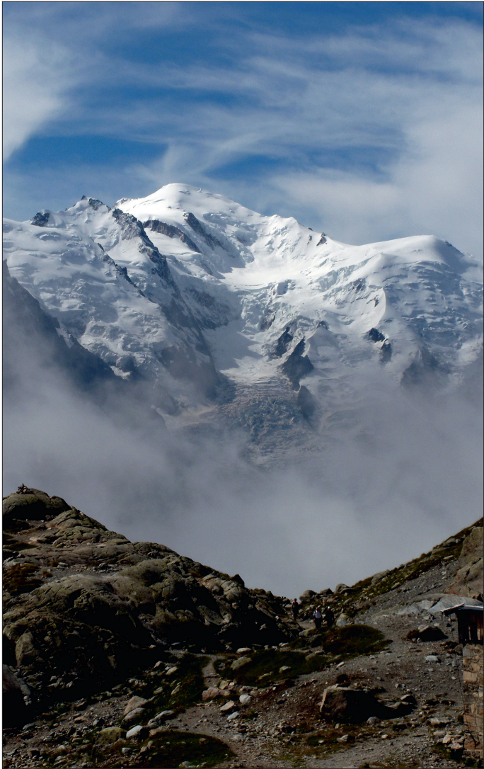
Le mont Blanc, vu depuis le lac Blanc.